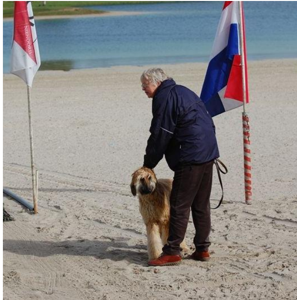
Henny op het Ronostrand